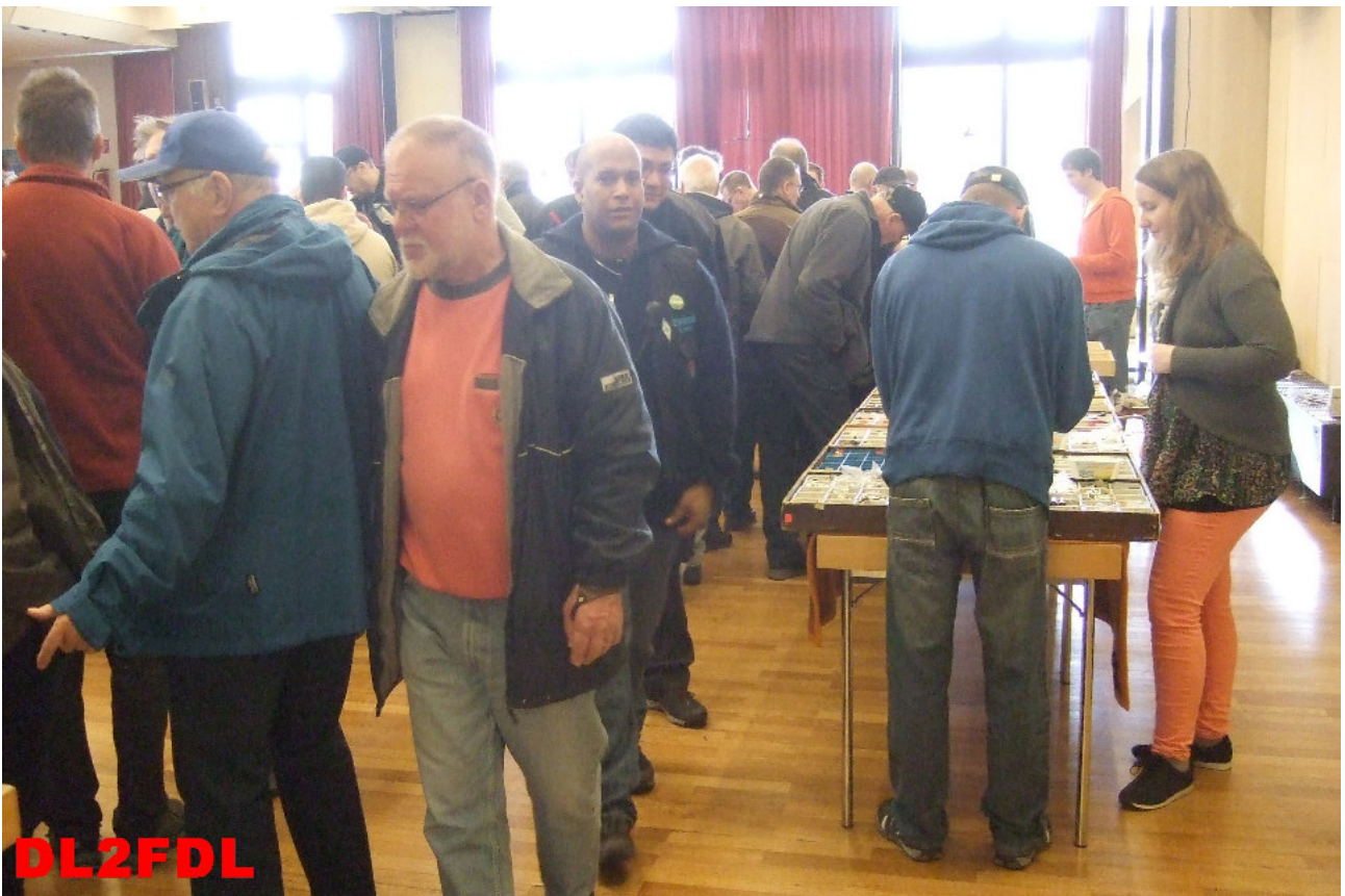
DL2FDL Das Flohmarkttreiben geht weiter .....