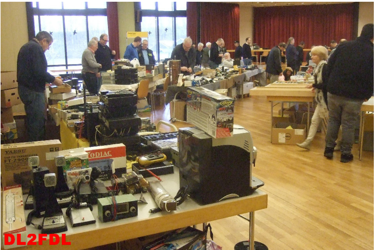
Aufbau der Aussteller