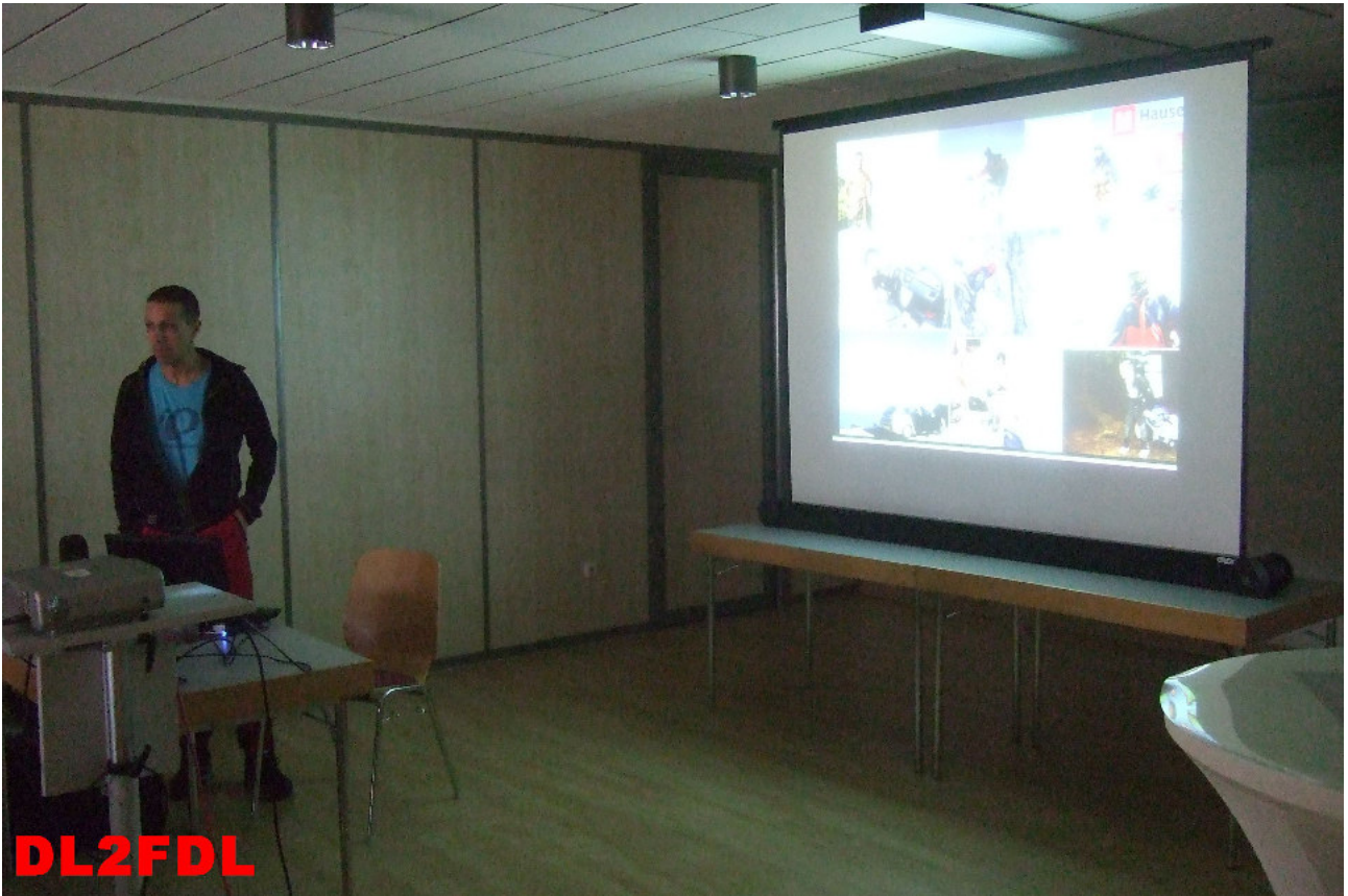
DL2FDL DL8JJ, Emil, H44GC, Salomon-Inseln DX-Pedition – Eine Expedition zu den Malariaemücken.