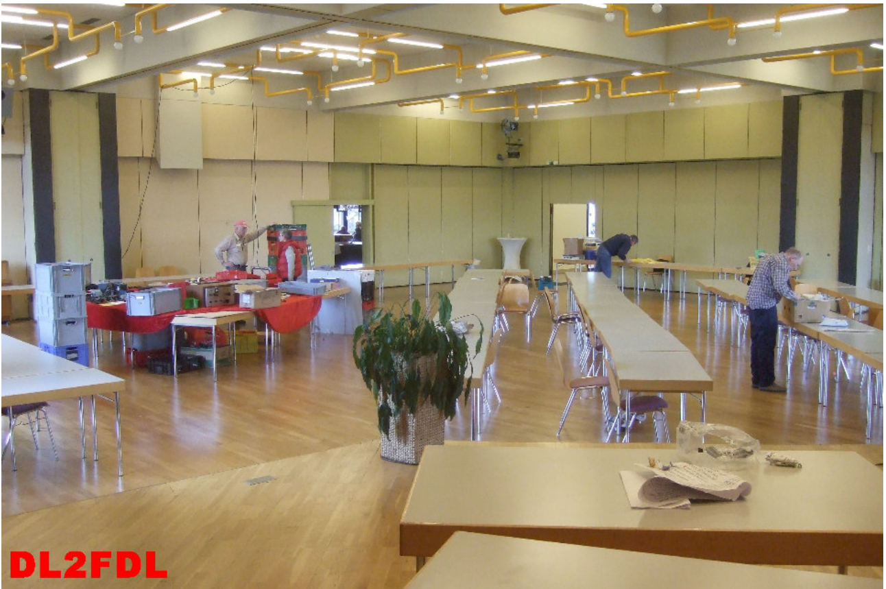
Eine fast aufgeräumte Halle gegen 16 Uhr .....