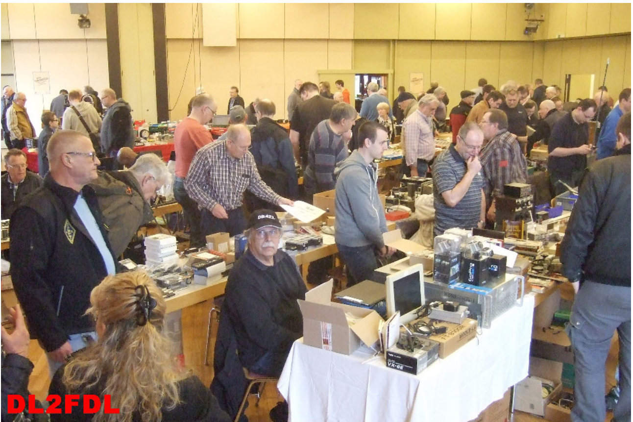
Um 9 Uhr füllt sich der Flohmarkt