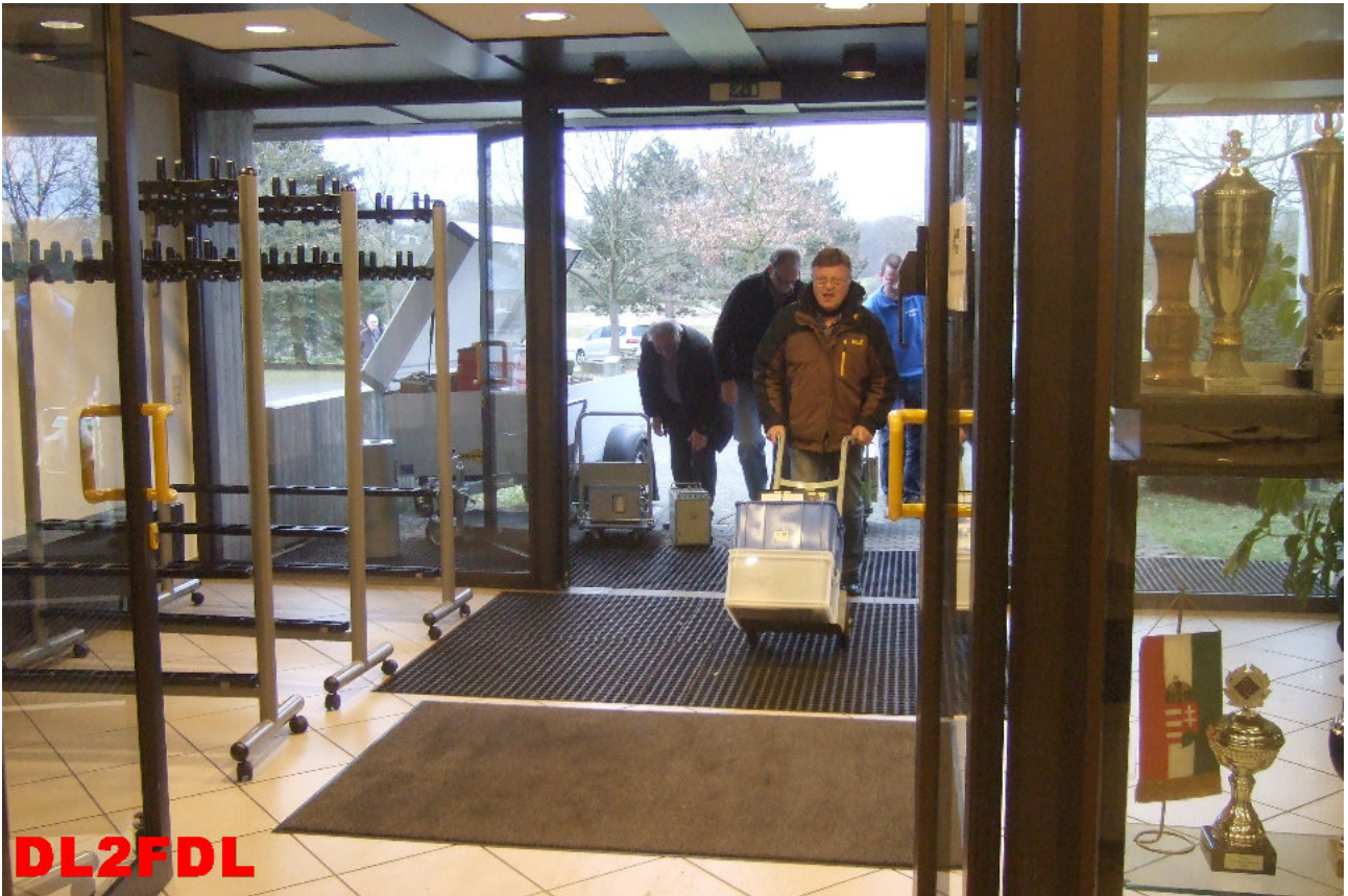
Einbringen der Ausstellungstücke zum Flohmarkt