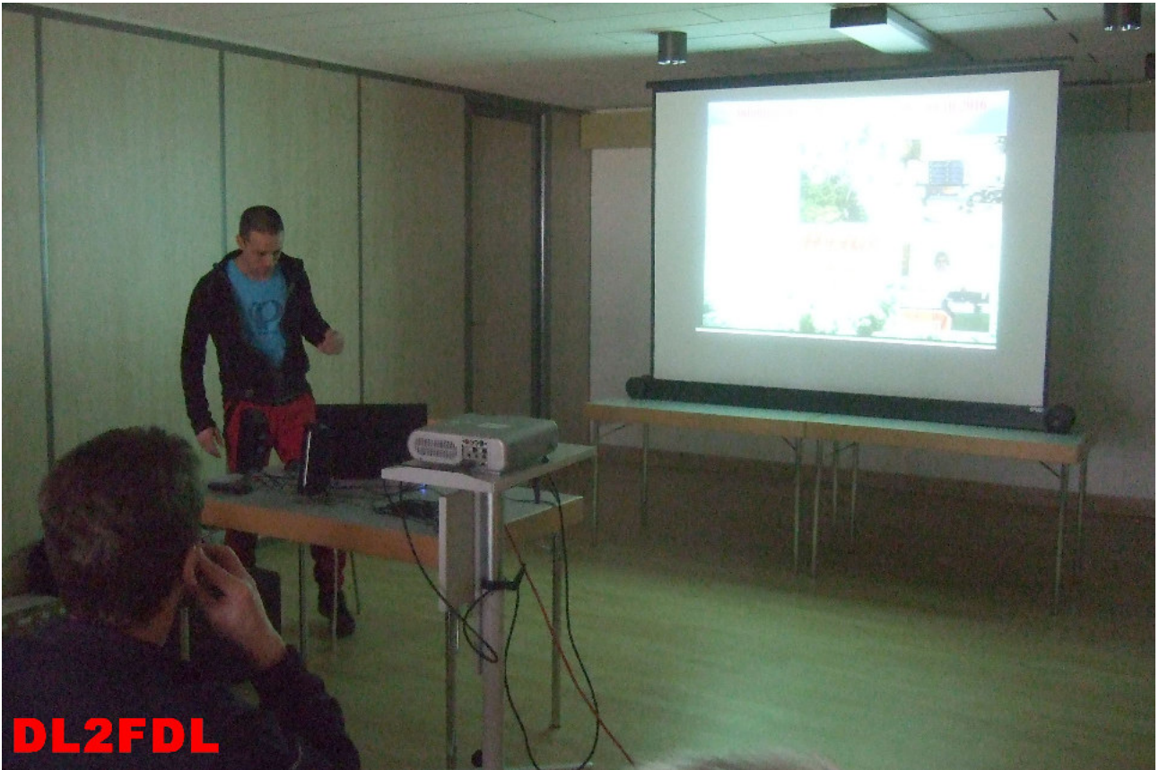
Die Vorträge beginnen, DL8JJ, Emil, H44GC, Salomon-Inseln DX-Pedition