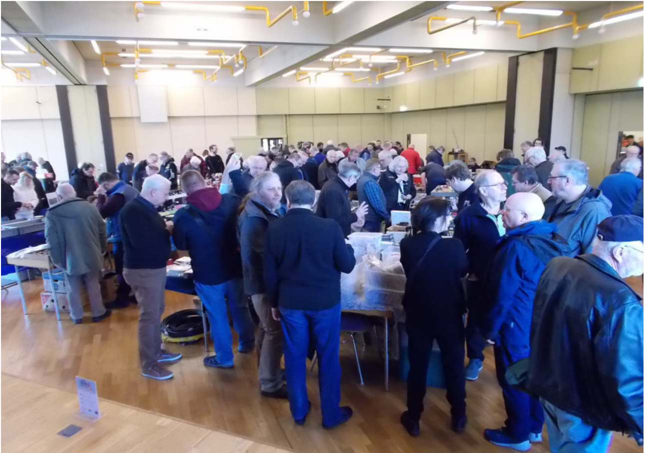
Der Raum füllt sich.....