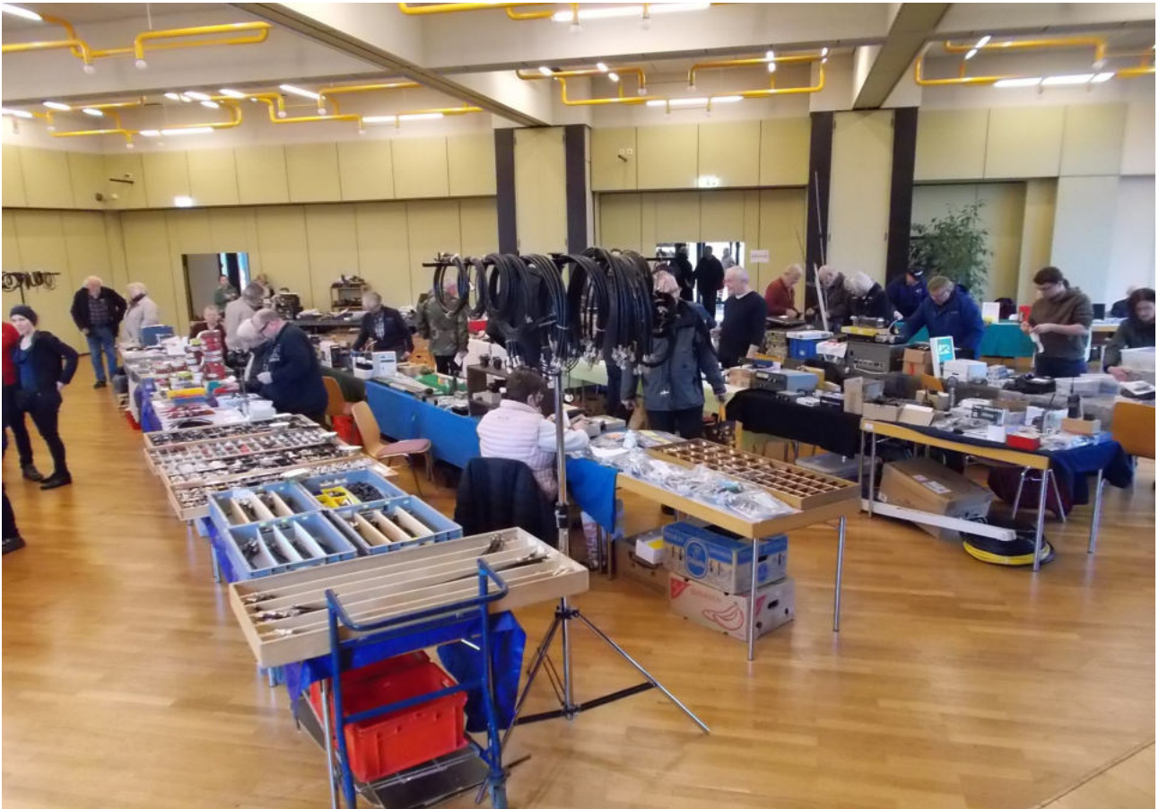
Nun ist der Aufbau beendet, gleich ist es 9 Uhr.