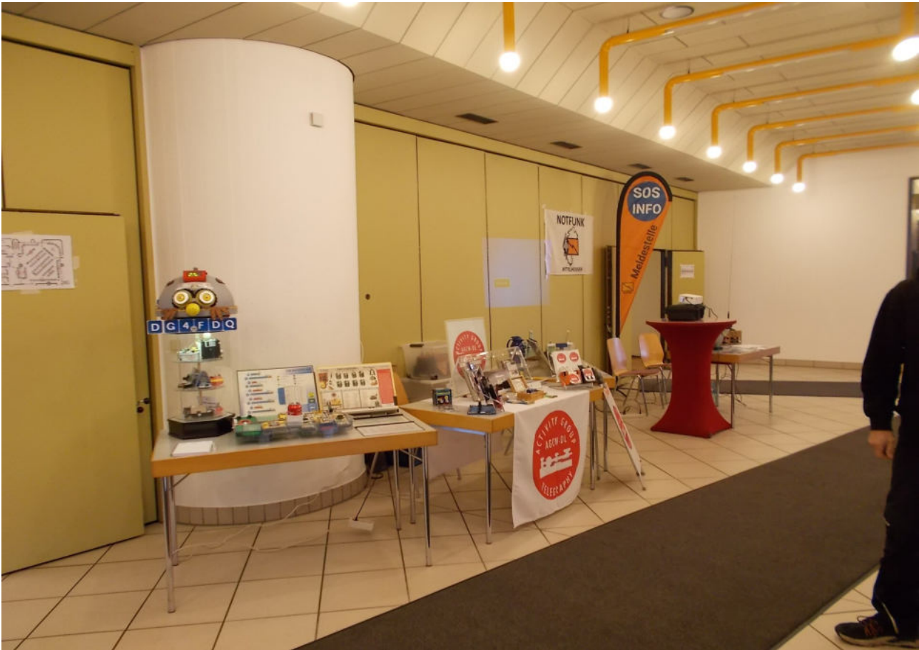
Guten Morgen und Willkommen .....