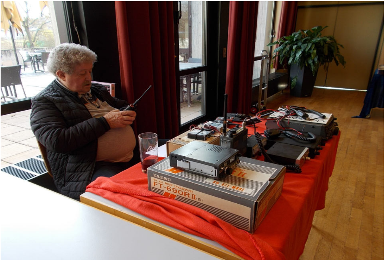
DJ8FT, Gerd sehr beschäftigt .....