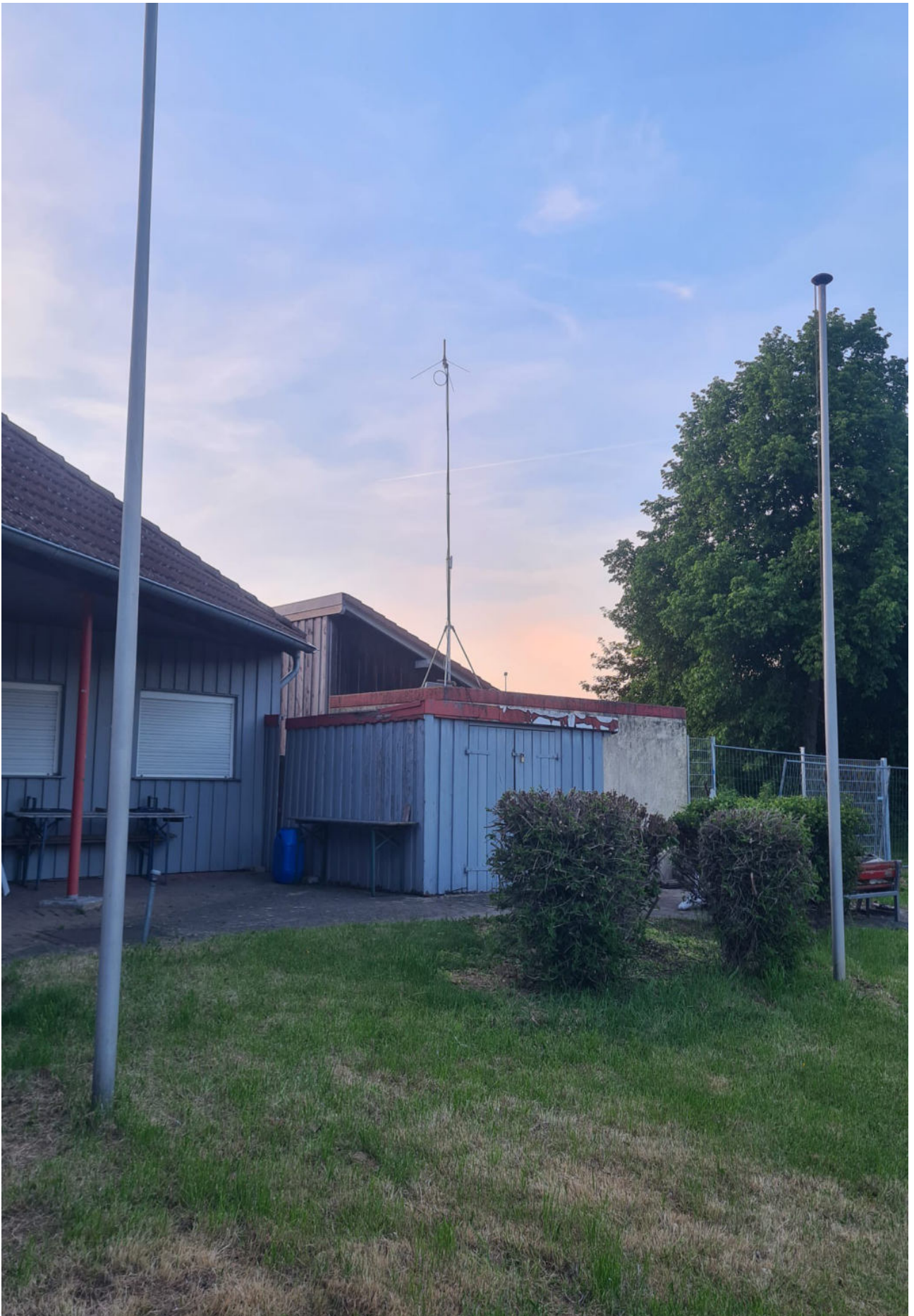
Antenne steht, Relaisfunkstelle läuft.