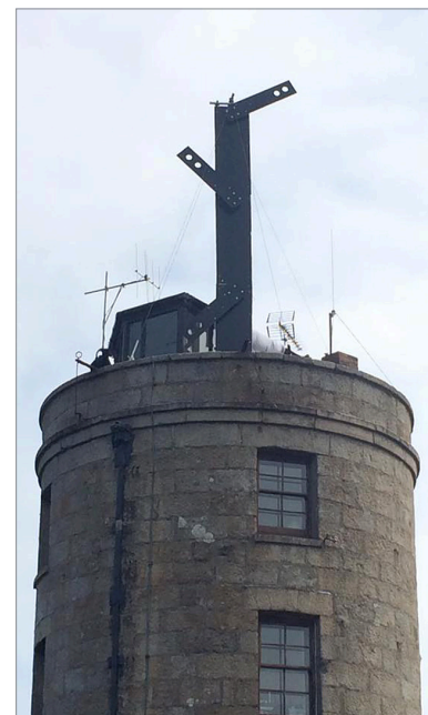
Der optische Telegraf auf der Turmspitze

Andreas Hahn, DL7ZZ Schneeheide 22 29664 Walsrode Tel. (0 51 61) 4 81 09 74 dl7zz@darc.de