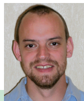
Beiträge für „Pile-Up“ an: