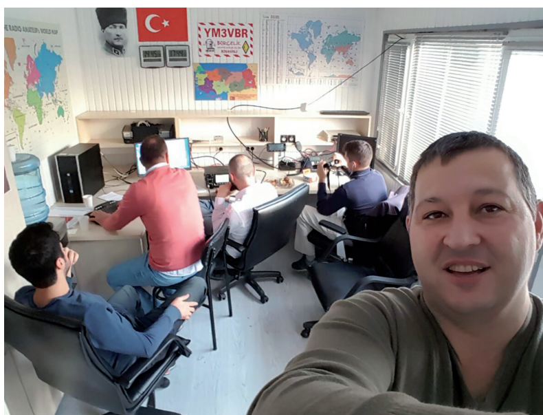
Funkbetrieb während eines Contests