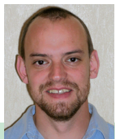
Beiträge für „Pile-Up“ an:

Stell dir vor, deine Mittagspause an einer Amateurfunkstation zu verbringen – wie klingt das? Dies machen wir, die Mitglieder von YM3VBR, seit drei Jahren. Als Chefoperator von YM3VBR, dem Borcelik Amateur Radio Club, möchte ich unsere Geschichte in einem kurzen Bericht teilen.