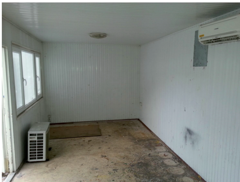
Die Clubräumlichkeiten vor der Renovierung