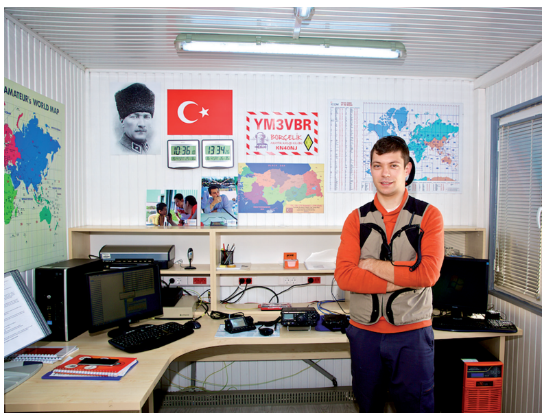
TA3KS an der Clubstation

Das Heft zum Thema Kurzwellen DX Handbuch