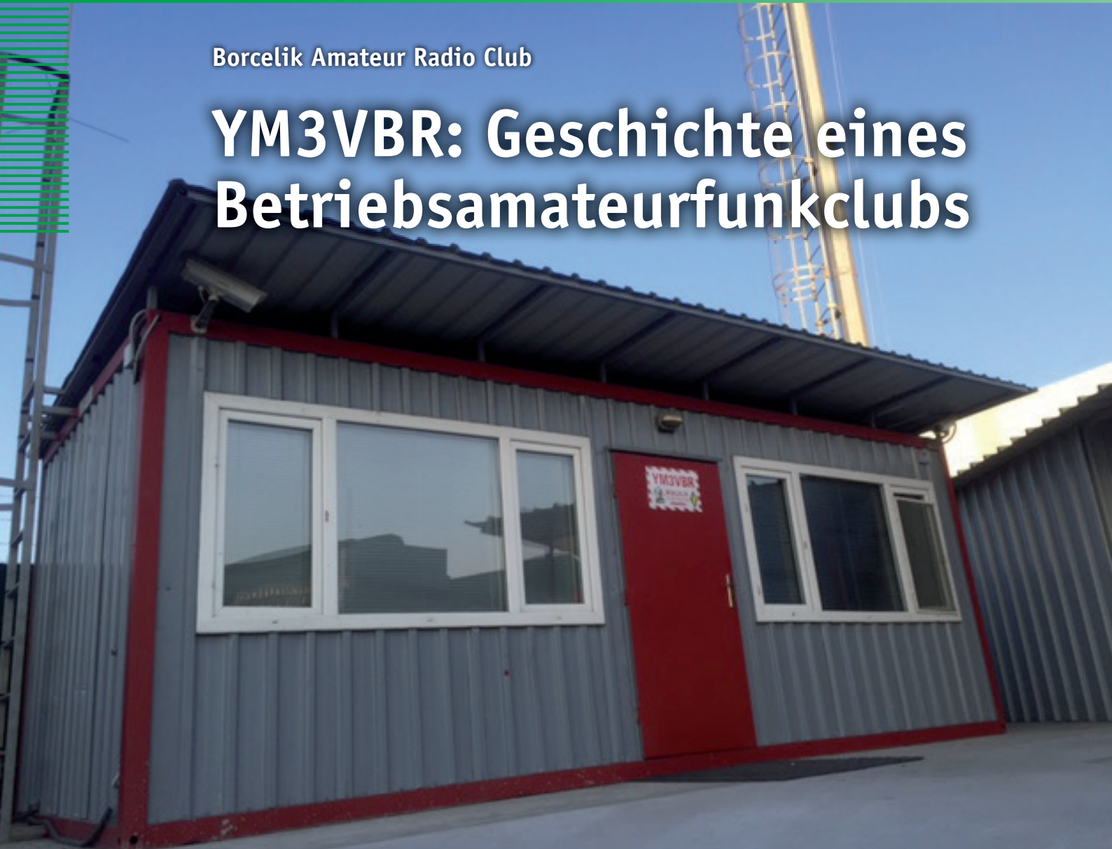
Außenansicht des Clubheims von YM3VBR – dem Borcelik Amateur Radio Club